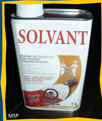
Solvant à peinture