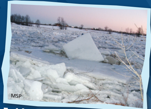
Fonte des neiges