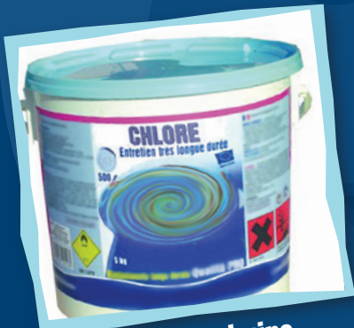
Chlore pour la piscine